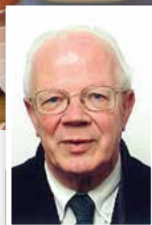
Auteur van deze brochure is ds. H. Veldhuizen, emeritus predikant te Wapenveld.

Uitgave van de Gereformeerde Bond in de Protestantse Kerk Bijlage bij De Waarheidsvriend , 23 mei 2014