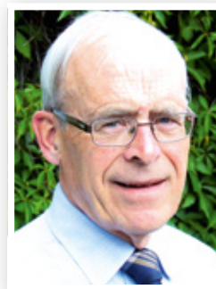
Auteur van deze brochure is dr. A.A.A. Prozman, emeritus predikant te Amersfoort.

Uitgave van de Gereformeerde Bond in de Protestantse Kerk Bijlage bij De Waarheidsvriend , 21 januari 2021