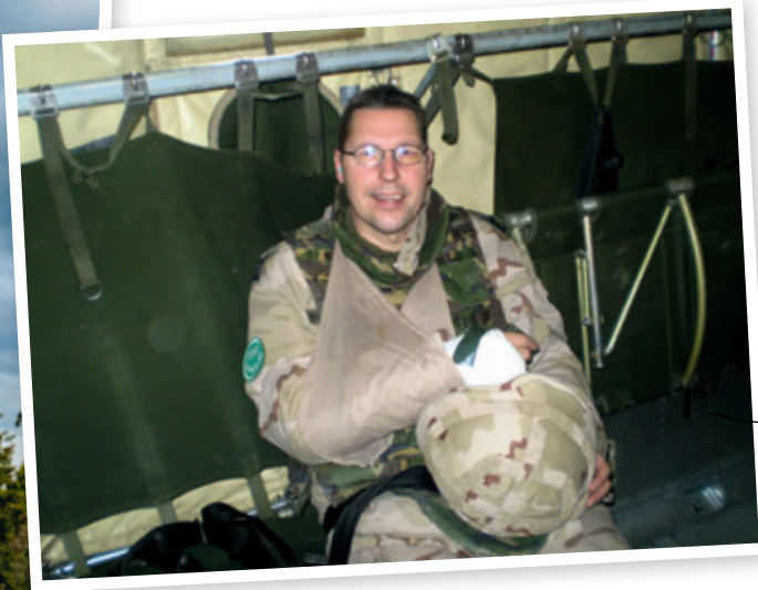
Eerste Kerstdag 2011, met een gebroken arm vliegend in Afghanistan, op weg naar de hoofdstad Kabul.

van alles gebeurt. Ik doe dat als christen. Ik doe dat als gelovig mens voor wie heel het leven zich afspeelt voor het aangezicht van God.