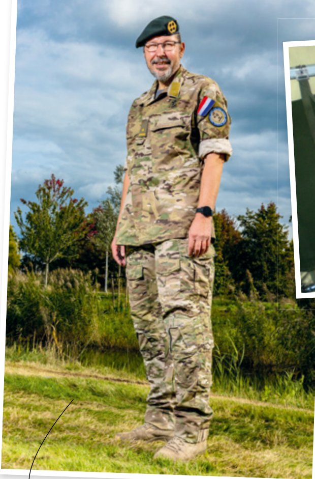
Thuis in Apeldoorn, in de kleding van de laatste uitzending naar Irak.